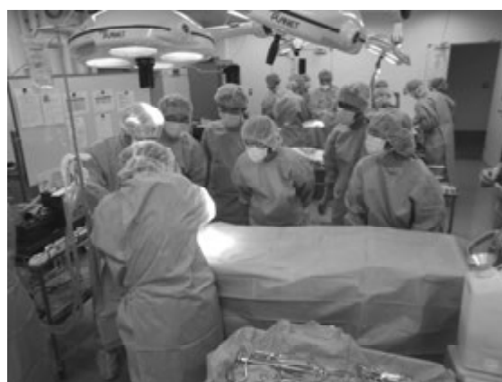
平成31年度 中動物部会 イヌ実技講習会