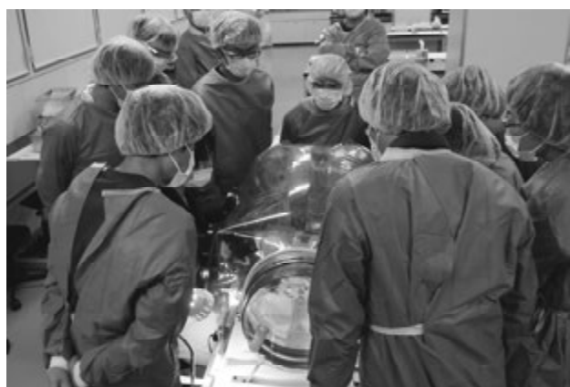
第412回本部共催実験動物実技講習会 微生物統御